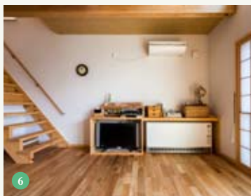
⑤ 「高齢になったら1階で生活できるように」LDKに小上がりの和室を併設。ゴロゴロくつろげ、腰掛けられ、下を収納に活用できる ⑥ シンプルな木のテレビボードを造作し、カウンターの下には蓄熱暖房機を設置。吹き抜け空間を穏やかに暖める