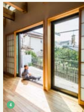
③ 雪見障子の下を開けて緑を楽しみ、外からの視線はカット ④ 窓を開け放つとデッキと一体化。忙しくて庭の手入れができないので、デッキを広く