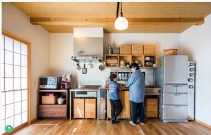
① LDK 内に階段を設け、吹き抜けで2階ともつながる、家族のコミュニケーションを大切にしたプラン。昔の日本の照明器具が味わい深い ② ステンレスでオーダーメイドしたキッチンは、扉がないから湿気がこもらず清潔。食洗機の前面には木を張った